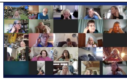
Participantes de 4 continentes y 6 países de todo el mundo

a aliviar los dolores y molestias a través de la relajación. La reflexología utiliza mapas que se asemejan al cuerpo humano que se pueden encontrar en los pies, las manos y las orejas externas. Al aplicar una presión suave, se puede trabajar el área de los mapas que se corresponden con la parte del cuerpo afectada. Además, se mostraron gráficos coloreados del cuerpo, los pies, las manos y las orejas para ilustrar las regiones coloreadas que indicaban dónde hacer Reflexología de Autoayuda en el propio cuerpo.