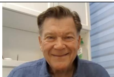
Paul Harvey: ¿Qué es la Reflexología? ¿Reflexología Prioritaria y Reflexología de Progresión?